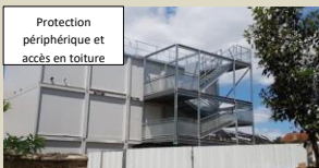
Protection périphérique et accès en toiture