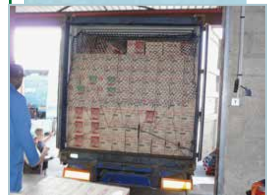
Filet tendu retenant les premières piles de colis

Demandé par le client à son fournisseur, la mise en place d'un filet retient les premières piles de colis accessibles.