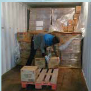
Pose des colis au ras du sol