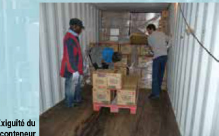
Exiguïté du conteneur

Le faible coût de la main d'œuvre des pays exportateurs, la réduction des coûts de transport, la nécessité de caler la marchandise et l'absence de palettes normalisées de dimensions sous-multiples de celles des conteneurs amènent les expéditeurs à charger les conteneurs en vrac, du plancher au plafond.