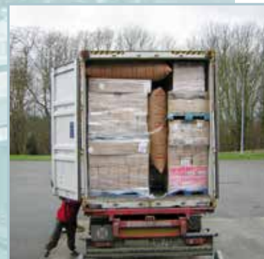
Palettes 80 x 120 avec des coussins de calage intercalaires

Le convoyeur doit être associé à un système de mise à niveau facilitant le dépilage ou l'empilage des colis sur les palettes (cf DTE 22-6 et DTE 22-7). Le filmage des palettes sera réalisé mécaniquement (cf DTE 22-3).