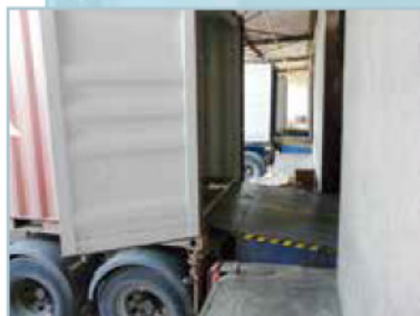
Forte dénivellation du niveleur