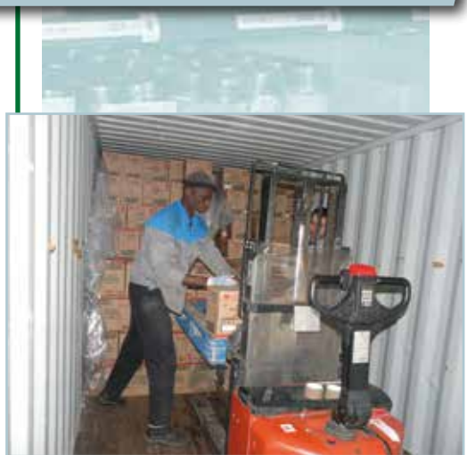
Transpalette gerbeur permettant d'élever le plan de pose