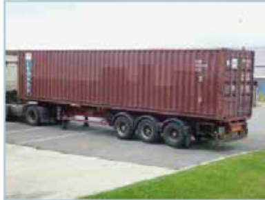
Conteneur 40 pieds