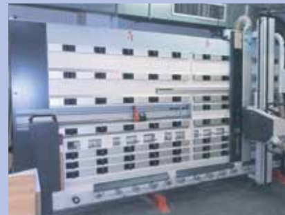
Scie à panneaux avec dispositifs de captage intégré