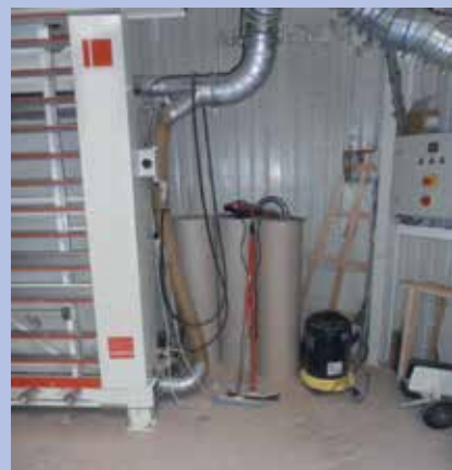
Nettoyage avec balais