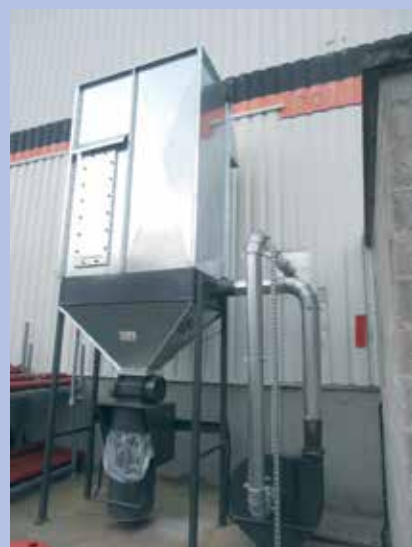
Groupe extraction-dépoussiéreur placé à l'extérieur