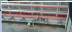
Poste de travail empoussiéré