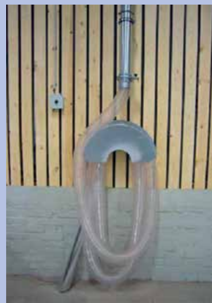
Nettoyage avec conduit raccordé au réseau d'aspiration