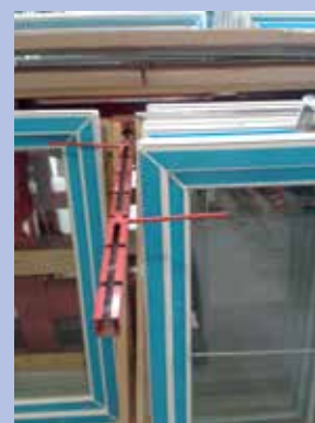
Dispositif de maintien