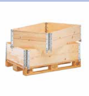
Caisse palette bois