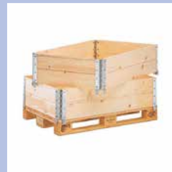
Caisse palette bois