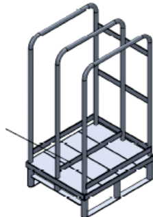
Support de stockage