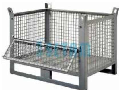
Caisse palette grillagée