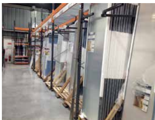
Barre de retenue